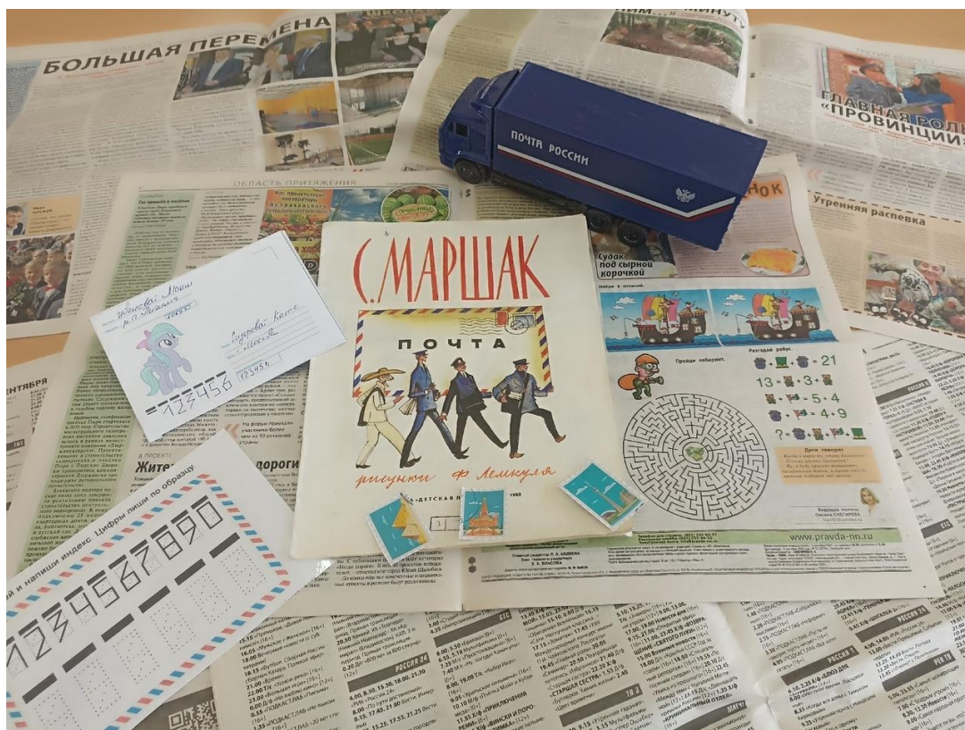
Рисунок 5 – расположение книги горизонтально, фото под углом

5. Делайте больше фото. Чем больше у вас будет различных фотографий с разных углов и ракурсов, тем больше шансов получить пар тройку действительно удачных фото.