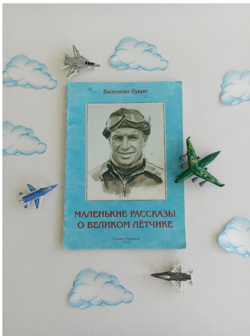
Рисунок 3 – пример буклука на белом фоне

1. Красивый фон – залог успешной композиции. Идеальный фон для фотографий – это белый, который удачно подойдет для 80% снимков. Основой фона может быть бумага для скрапбукинга, тканое полотно, панели и др. Самое главное, чтобы выбранный вами задний план не отвлекал внимание от создаваемой композиции. Природа, окружающий мир также могут стать хорошим фоном и реквизитом.