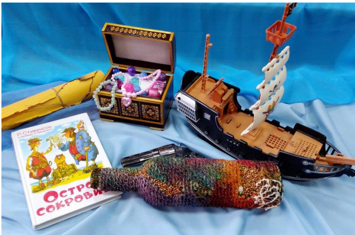
Рисунок 1 – образец буклука

Буклук можно перевести как «книжный натюрморт» или «фотосессия для книги».