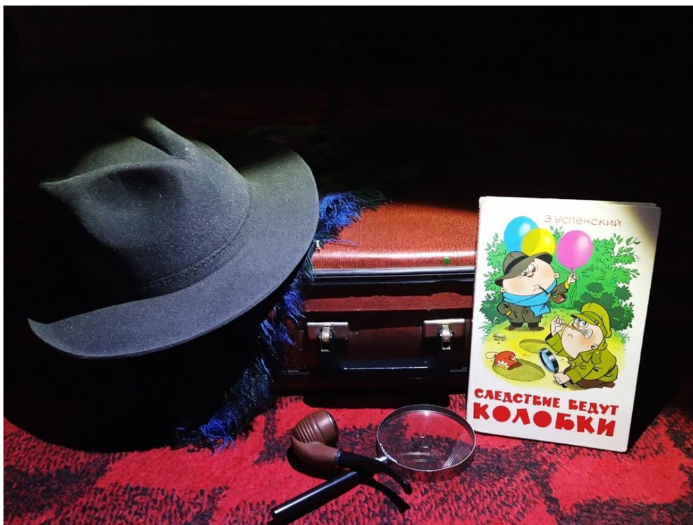
Рисунок 4 – пример буклука в искусственном освещении

2. Ставим свет. Естественный свет от окна самое лучшее, чтобы получить мягкое и спокойное освещение для фотографии. Фотографируйте, когда на улице светло. Установите вашу композицию прямо на подоконнике. Или попробуйте использовать для освещения настольную лампу, фонарик, гирлянду или свечку, чтобы создать атмосферу тайны, загадочности или напряжения и пр.