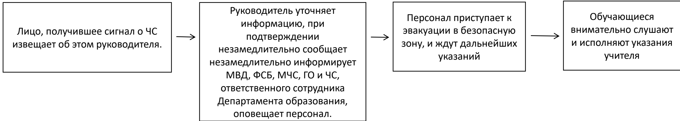
Схема действий руководителя, персонала и обучающихся при химической или биологической угрозе

ЕСЛИ ЭВАКУЦИЯ НЕВОЗМОЖНА, НЕОБХОДИМО ОСТАТЬСЯ В ПОМЕЩЕНИИ И ПРОИЗВЕСТИ ЭКСТРЕННУЮ ГЕРМЕТИЗАЦИЮ ОКОН, ДВЕРЕЙ. ЗАНЯТЬ БЕЗОПАСНЫЙ ЭТАЖ В ЗАМИСИМОТИ ОТ СОСТАВА ХИМИЧЕСКОГО ВЕЩЕСТВА