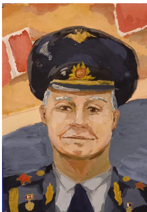
Рисунок А.3 – детская работа (участник мероприятия)