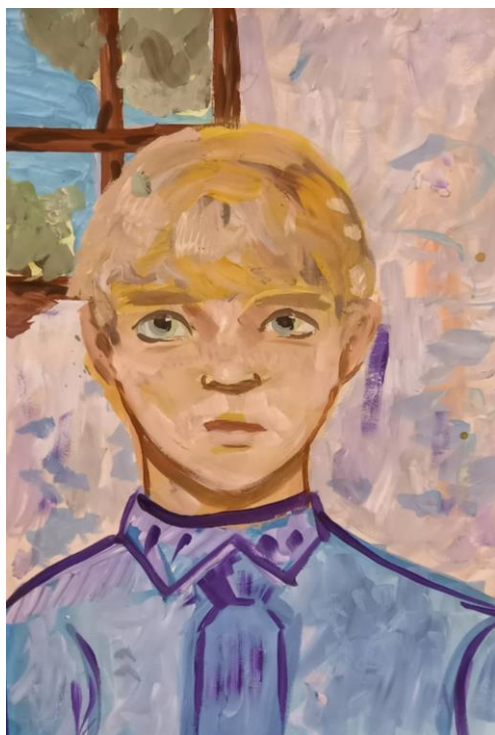
Рисунок А.2 – детская работа (участник мероприятия)