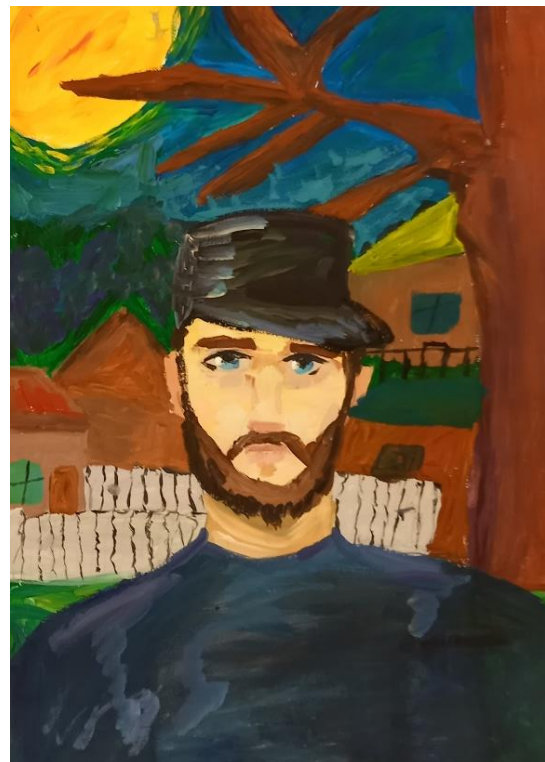
Рисунок А.7 – детская работа (участник мероприятия)