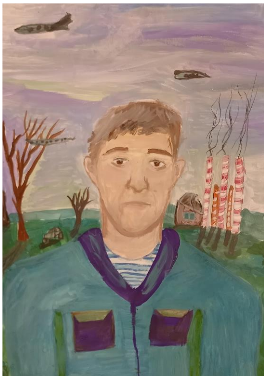
Рисунок А.6 – детская работа (участник мероприятия)