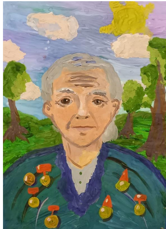
Рисунок А.5 – детская работа (участник мероприятия)