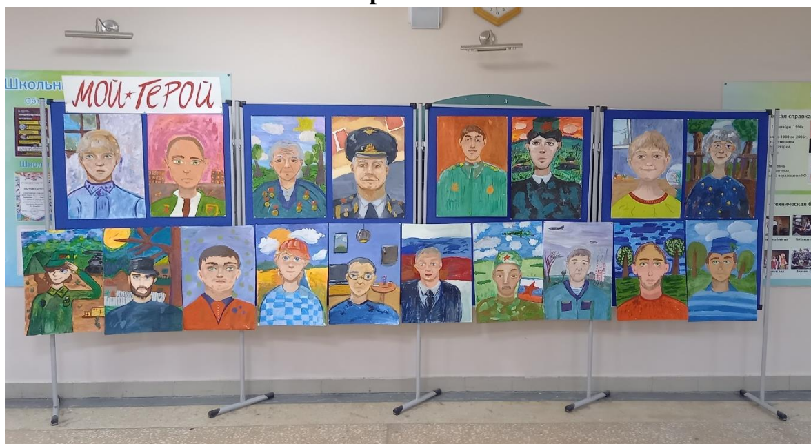
Рисунок А.1 – выставка детских работ, приуроченная ко Дню защитника Отечества.